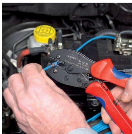
97 52 37