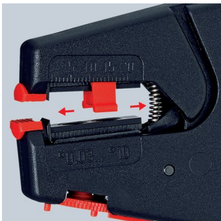
12 40 200: Verstelbare lengteaanslag

Onder voorbehoud van technische wijzigingen en vergissingen