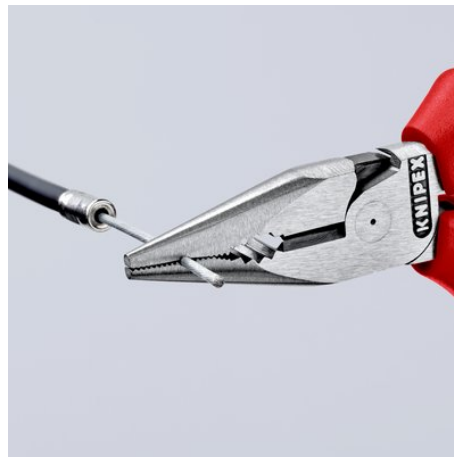
vaste grip, ook aan vlakke delen door het driepunten-oplegstuk