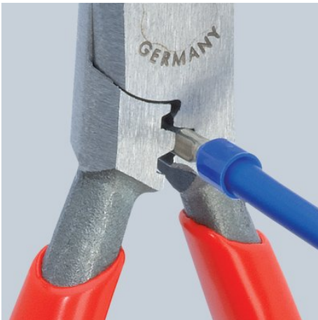
Crimpaggio da 0,5 a 2,5 mm 2