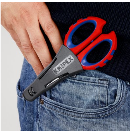
!Sicher verstaut und immer griffbereit!

Oikeus teknisiin muutoksiin ja virheisiin pidätetään