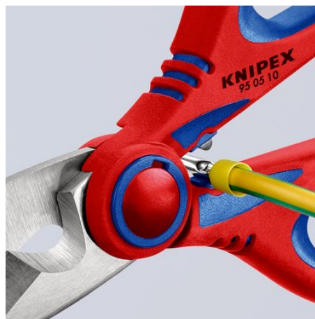
Nopea, helppo puristus