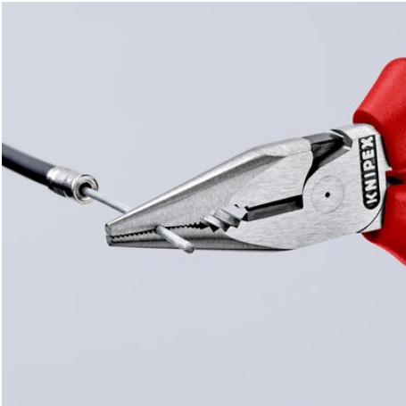
Jyrsitty ura tartunta-alueella