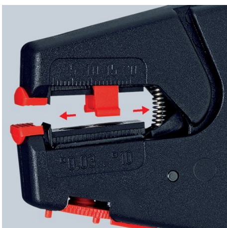
12 40 200: Nastavitelný délkový doraz