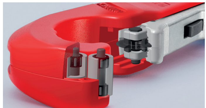
Med nållager av hög kvalitet fungerar kaptrissan och de fyra styrrullarna praktiskt taget utan någon irriterande friktion under kapningen – underlättar speciellt kapning av rör i rostfritt stål