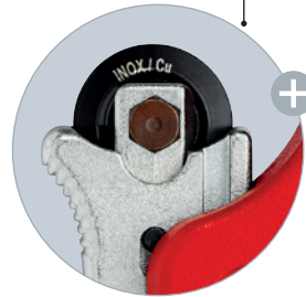
Den nållagrade och dämpade kaptrissan i högkvalitativt kullagerstål är enkel att byta ut