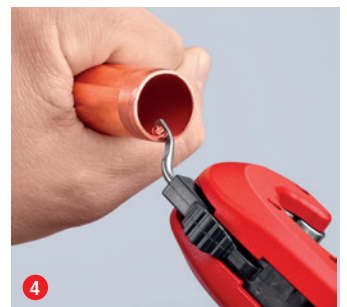
4 Sen är du klar! Jämn av kanten vid behov med det utfällbara avgradningsverktyget – med ytterst liten ansträngning