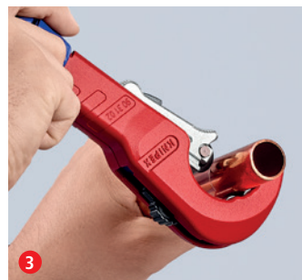
3 Kapa med en snabb vridning. Justera sedan med det ergonomiska blå tumhjulet ...