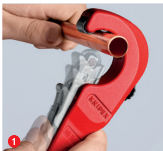
1 Enkelt att kapa: Placera den öppna KNIPEX TubiX® ...