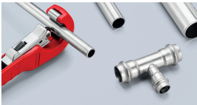
Snabba ryck i det dagliga arbetet: med QuickLock-enhandssnabbjusteringen kan kaptrissan glida till valfri rördiameter med ett enda tryck med tummen