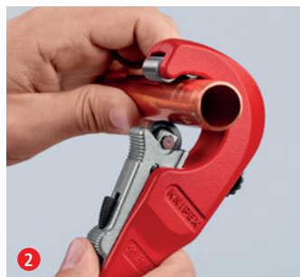
2 Tryck kaptrissan mot röret med QuickLock-enhandssnabbjustering: snabbast justering för olika rördiametrar ...