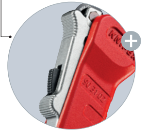
Den dämpade kaptrissan kan skjutas och fixeras till diametern på röret med enhandssnabbjusteringen