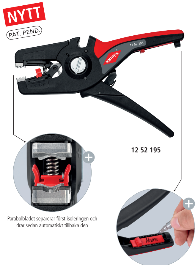
Parabolbladet separerar först isoleringen och drar sedan automatiskt tillbaka den