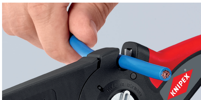
Med kabelavbitare på ovansidan för upp till 16 mm 2