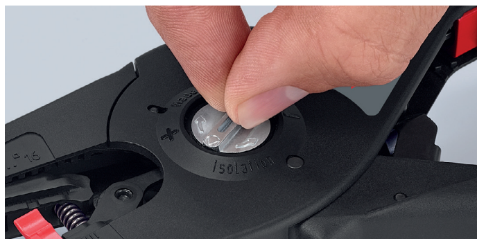
För en mängd specialkrav, t.ex. särskilt hårda eller mjuka isoleringsmaterial, kan optimala finjusteringar göras med hjälp av justeringshjulet med dess taktilla läspositioner