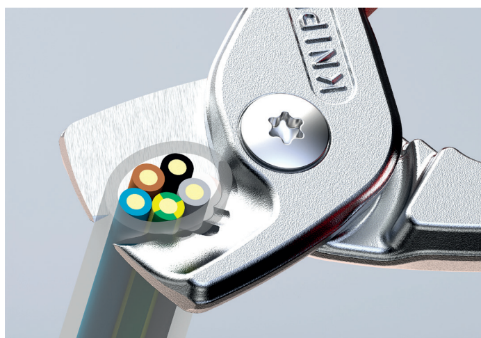
Leikkaa yksijohtimisia kupari- ja alumiinikaapeleita, joiden koko on jopa 5 x 4 mm 2

Porrastettu terä leikkaa johtimet portaittain, vaiheittain ja