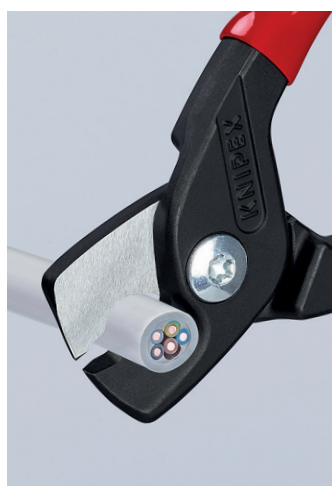
Ruuvattu nivel: tarkka, vaivaton, kestävä; puristussuoja asennettu turvallista työskentelyä varten